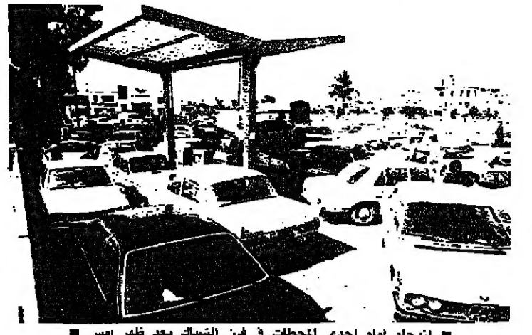
ازمة امام احد المحطات في فين الشيا بعد ظهر امس

ازمة البنزين تراوح مكانها مستقلة في بيروت الغربية، ومرشحة للنفاق في البقاع، بين فين في بيروت الشرقية وجبيل وكسروان. رئيس الحكومة السيد رشيد كرامي استدعى مدير عام النفط السيد ريمون روفيل واطلع منه على اوضاع المحروقات خصوصا لجهة تأمين حاجات جميع المناطق. روفيل قال بعد المكالمة ليس هناك من ازمة توزيع محروقات، ولكن ازمة على الارض. اضاف: نحن نقوم بتسليم الكميات اللازمة التي يحتاجها السوق. وسئل عن المعالجات الجارية فقال: اننا نحاول تأمين وصول الكميات المسجلة الى المحطات. وسئل: يقال ان هناك بعض عناصر في وزارة النفط تمهتة بتهرب كميات البنزين الى الخارج. فقال: استنكر ان يصدر اي ارقام لاي عنصر لانه اذا كان هناك من تهريب الى الخارج فانه يكون عن الحدود وليس يعقد الوزارة ان تغفل شيئا لانها في مقتدرها التي تسلم الكميات في مستودعات الحدود وفي مصفاة الزهراني وطرابلس.